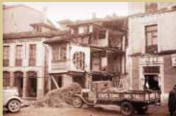
La proximidad al frente de la villa de Grado durante trece meses de guerra, la convirtió en blanco de los bombardeos aéreos y artilleros republicanos, que causaron numerosos desperfectos.