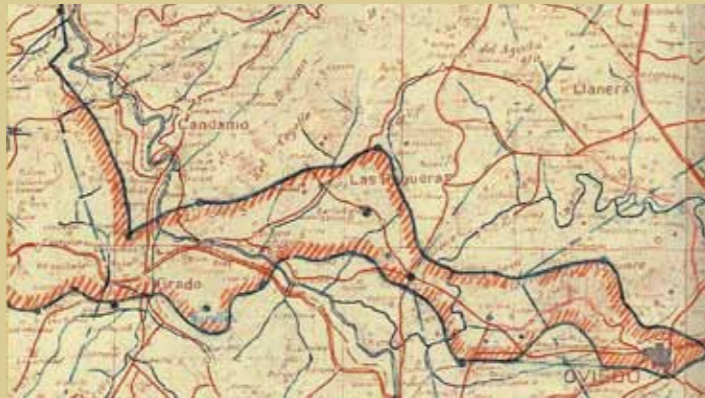
Mapa del “pasillo” de comunicación entre Oviedo y Grado trazado después de la ofensiva republicana de febrero/marzo de 1937, en que los atacantes lograron cortar la carretera de San Claudio a la altura de la loma de Pando.