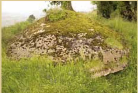
(Izda.) Nido de ametralladoras en San Pelayo Sienna. (Dcha.) El coronel don Antonio Aranda Mata, jefe de la Comandancia Exenta de Asturias, establecería su puesto de Mando en Grado tras la ruptura del cerco de Oviedo.