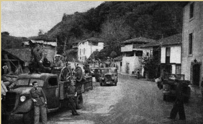
Batería motorizada de las Columnas Gallegas avanzando en dirección a Grado.

Esta vivencia guerrera propició en el frente Sur, en el que ambas líneas enemigas discurrían por territorio de Grado, la construcción de numerosas fortificaciones de hormigón por parte republicana (los nacionales no levantaron obras de este tipo, siendo sus posiciones simples trincheras excavadas en el terreno y reforzadas con alambre de púas y parapetos de sacos terreros) de las que buen número han llegado hasta nuestros días, constituyendo estos testigos materiales de la contienda un conjunto de bienes históricos sobre los que ha actuado el Ayuntamiento de Grado para conservarlos, adecentarlos, abrir accesos y señalizarlos a fin de ponerlos en condiciones dignas y fáciles de visitar, tanto para los habitantes del concejo, como para los foráneos interesados en el conocimiento y estudio de nuestra reciente historia.