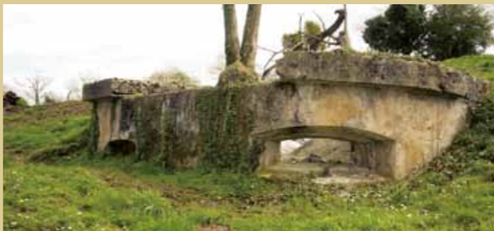
Vista actual de la casamata de Las Ordaliegas

A partir de este momento, la línea del frente ante el Monte de los Pinos se mantuvo sin cambios hasta el final de la guerra. Ello explica que las obras de fortificación que entonces se levantaron, estén situadas en un semicírculo en torno a dicho monte; algo que facilita en buena medida su visita.