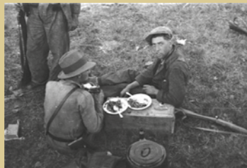
(Izda.) Milicianos republicanos en el frente de Grado en un momento de descanso. Se trata de los mismos que podemos ver en una foto de la cara interior manejando una ametralladora (Constantino Suárez. Muséu del Pueblu d'Asturies). (Dcha.) 25 de septiembre de 1936. Parapeto republicano dando frente al río Nalón (Constantino Suárez. Muséu del Pueblu d'Asturies).

RUTA DE FORTIFICACIONES DEL FRENTE DE GRADO 1936/1937