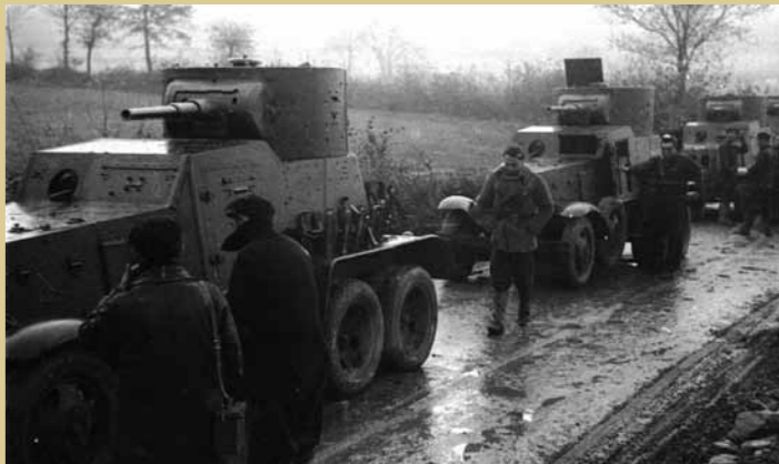
1 de diciembre de 1936. Blindados soviéticos -autometralladoras-cañón BA.6 y autometralladoras FA-I- dispuestos a iniciar el ataque por la carretera que, desde Reconco, baja hacia La Mata