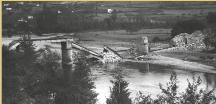
25 de septiembre de 1936. Puente de Sandiche, sobre el Nalón, volado por los republicanos.