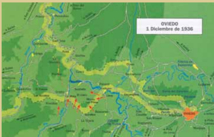
Mapa del ataque republicano de 1 de diciembre de 1936, el de mayor envergadura de los que tuvieron por objetivo Grado, efectuado desde las direcciones Llera-Vega de Anzo, Gurullés- Monte Los Pinos y Reconco-La Mata.

El 7 de septiembre, después de mes y pico de duras luchas, entraban las Columnas Gallegas en Muros, San Esteban y Pravia y, el día 15, lo hacían en Grado, culminando así la ocupación del Occidente asturiano. Hacía veinticinco días que los defensores del cuartel de Simancas, en Gijón, habían sido aplastados y los puentes más importantes sobre el Nalón habían sido volados por las milicias gubernamentales en su retirada. Carecía, por tanto, de objeto continuar el avance por la costa, aconsejando la situación concentrar todos los esfuerzos en el socorro de los cercados en Oviedo. Pero la carretera general de Grado a la capital asturiana atravesaba el angosto desfiladero de Peñaflo, muy favorable a la defensa, por lo que las fuerzas nacionales decidieron flanquearlo por el Sur y marchar hacia Trubia por la carretera local que sube por La Mata a San Martín de Gurullés. La operación comenzó el 18 de septiembre con buen pie, pues en esa misma jornada los gallegos ocupaban el Monte de los Pinos, pero en él quedaron frenados. Las milicias republicanas se rehicieron y, el día 20,