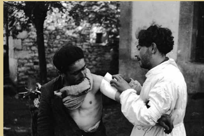
26 de septiembre de 1936. Un sanitario republicano procede a la cura de un herido en el frente de Grado.

lanzaban un fuerte contraataque que cortaba de raíz el avance nacional y conseguían el 22 recuperar la citada posición. El 23, volvían a ocuparla los nacionales, pero una serie de durísimos y sangrientos contraataques republicanos a lo largo de los días 27, 28, 29 y 30 de septiembre y 1 de octubre, si bien no lograron tomar el monte, fueron suficientes para convencer a las tropas de Galicia de la imposibilidad de proseguir su avance en esa dirección.