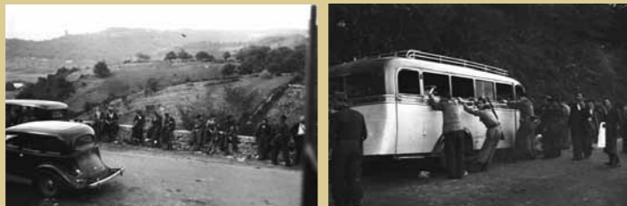
26 de septiembre de 1936. Milicianos asturianos se aprestan a cortar el paso de las tropas de Franco hacia Oviedo por la carretera general. Aunque parecen relajados e, incluso, festivos, se lo pusieron muy difícil a los gallegos.

Tal situación exigiría el envío desde Galicia —cuyas cuatro provincias se habían posicionado a favor del bando sublevado— de fuerzas militares en