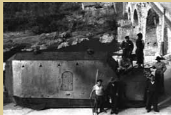
26 de septiembre de 1936. Milicianos republicanos que defendían el puente de Peñaflo, ya caído Grado en poder de las Columnas Gallegas, apoyados por un blindado artesanal.

ayuda de sus correligionarios sitiados en los dos focos de resistencia asturianos citados. Las primeras columnas de socorro gallegas entraron en Asturias por la costa, por el puente de Ribadeo, el 30 de julio y desde León, por el puerto de Leitariegos, el 18 de agosto.